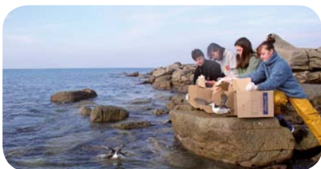
Guillemots de Troil