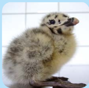
Poussin de goéland