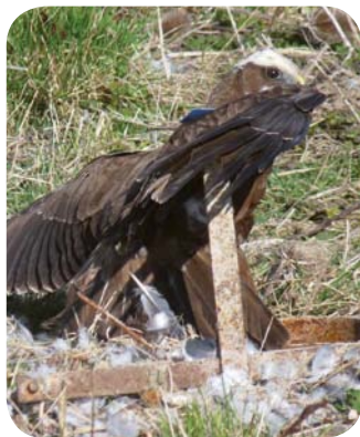
Busard des roseaux

La chasse, le tir illégal, les pratiques régionales ou le trafic des espèces protégées (collection personnelle, revente...) peuvent mettre en péril certaines espèces protégées ou menacées. La LPO lutte contre tous ces excès, contre le piégeage, le braconnage des petits passereaux (pinsons, ortolan, chardonneret pour l'alimentation ou le commerce) et le massacre des rapaces. Quotidiennement, elle surveille, dénonce, agit en justice en portant plainte et en se constituant partie civile lors des infractions aux dispositions législatives relatives à la protection de la nature et de l'environnement.