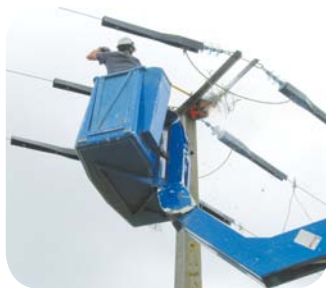
Nid de cigogne en feu

Sur les lignes existantes, dans les couloirs de migration en particulier, des spirales rouges et blanches sont fixées sur les câbles pour que les animaux puissent mieux identifier l'obstacle.