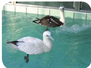
Fous de Bassan