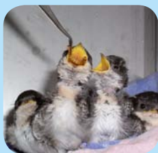
Hirondelles de fenêtre