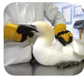
Fou de Bassan