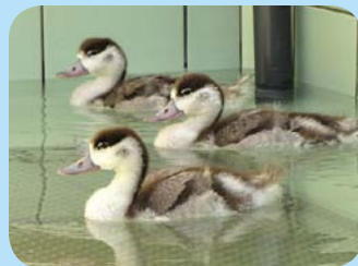
Tadornes de Belon

Trouver un oisillon au sol, fait partie des expériences auxquelles chacun peut être confronté un jour ou l'autre. Enfants ou adultes, nous sommes souvent démunis devant le désarroi de cet être fragile. Bien sûr, tomber du nid fait partie des aléas de la vie d'oiseau, et certains oisillons téméraires peuvent rapidement s'aventurer hors du nid au péril de leur vie. Les jeunes de plusieurs espèces, tels les chouettes, les grives ou les merles, quittent régulièrement le nid avant de savoir voler, en essayant de suivre leurs parents qui cherchent leur nourriture. Ces oisillons poussent de petits cris plaintifs. On peut alors croire qu'ils ont été abandonnés, mais la plupart du temps les parents se trouvent aux alentours, attendant que vous soyez éloigné pour revenir s'occuper de leur progéniture.