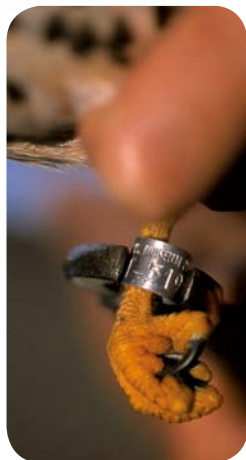
Bagueage d'un faucon crécerelle

Envoyez ces informations au Centre de Recherches par le Bagueage des Populations d'Oiseaux (CRBPO) - 55 rue Buffon - 75005 PARIS - 01 40 79 30 78 - site web : http://www2.mnhn.fr/crbpo/