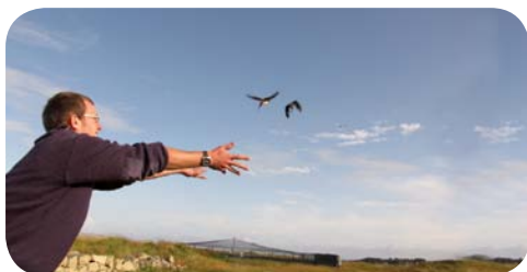
Hirondelles de fenêtre